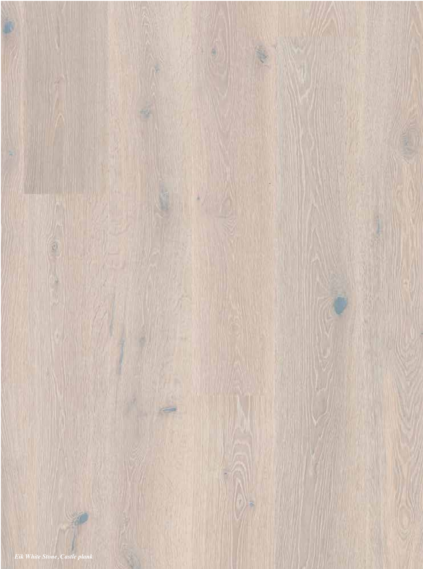
Eik White Stone, Castle plank