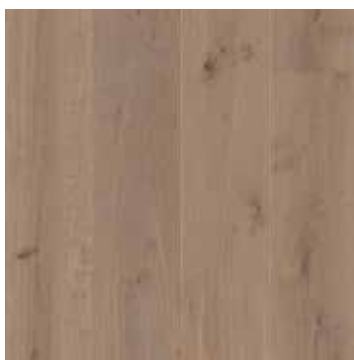
Eik Warm Grey