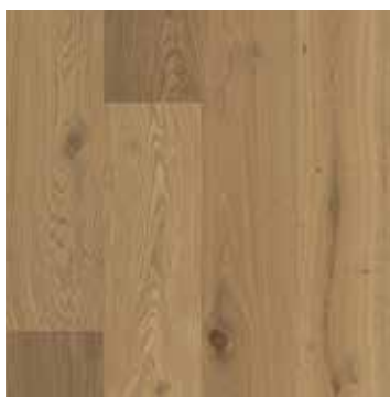
Eik Semi Smoked