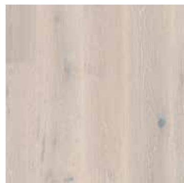
Eik White Stone