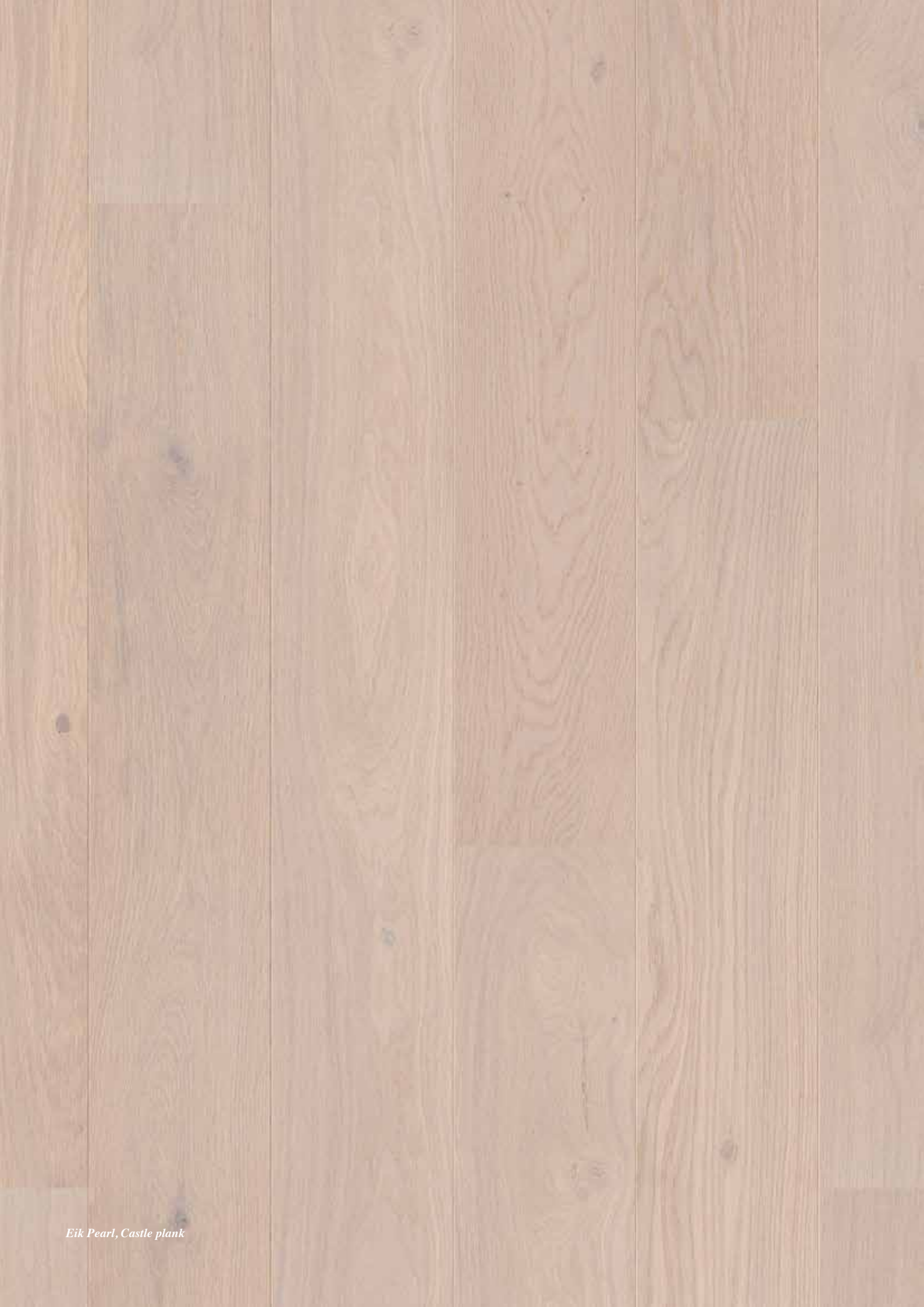
Eik Pearl, Castle plank