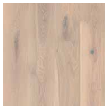
Eik Pale White