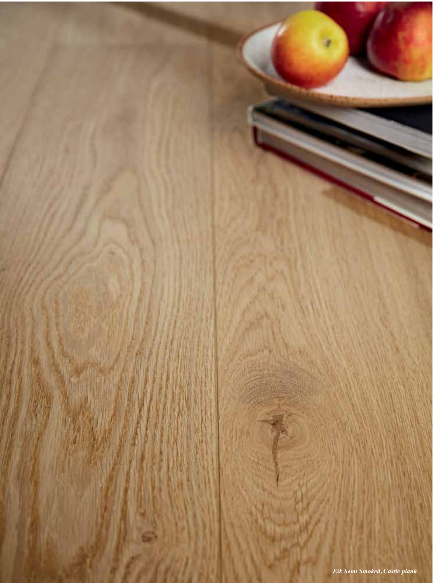
Eik Semi Smoked, Castle plank