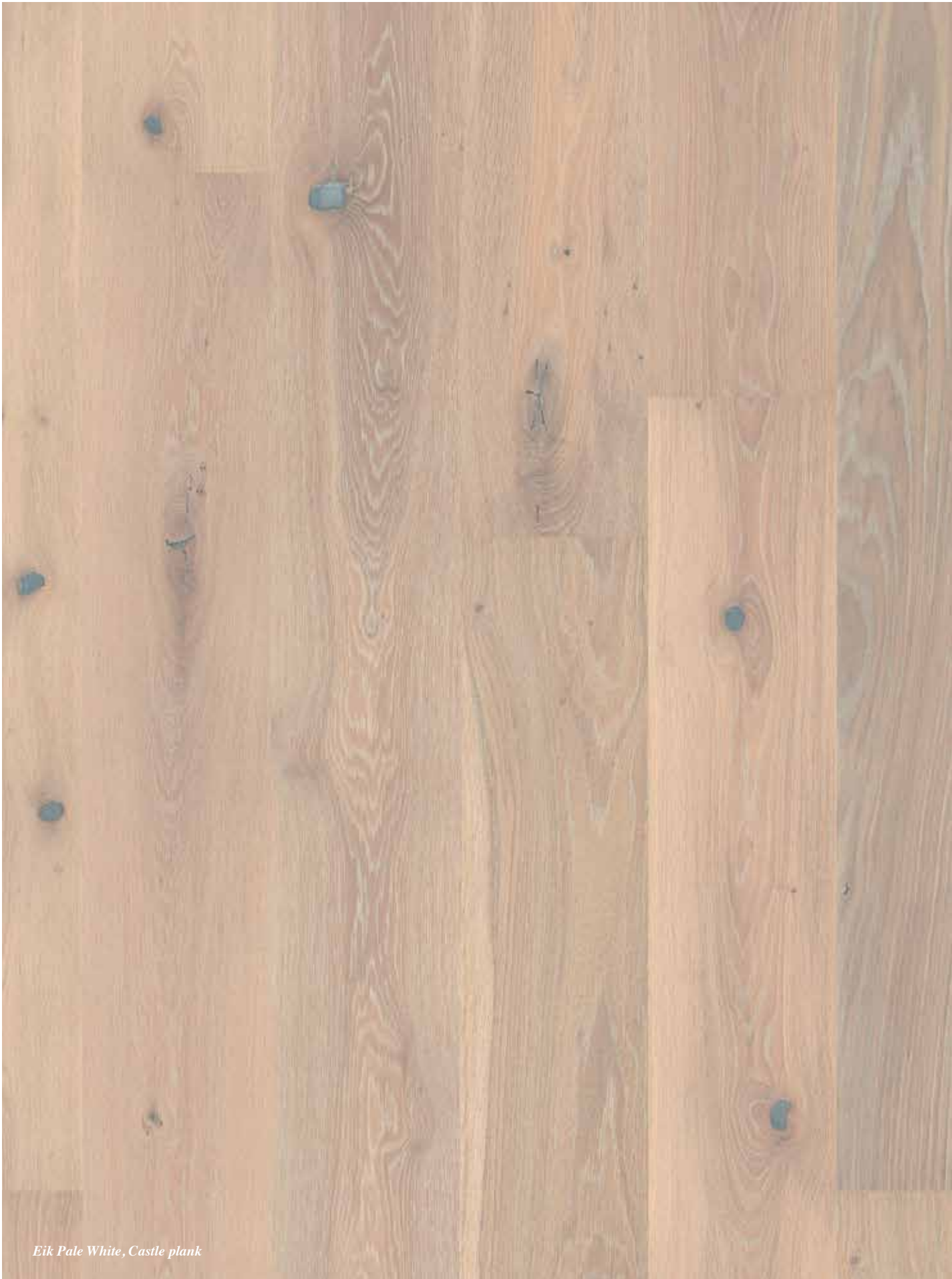
Eik Pale White, Castle plank